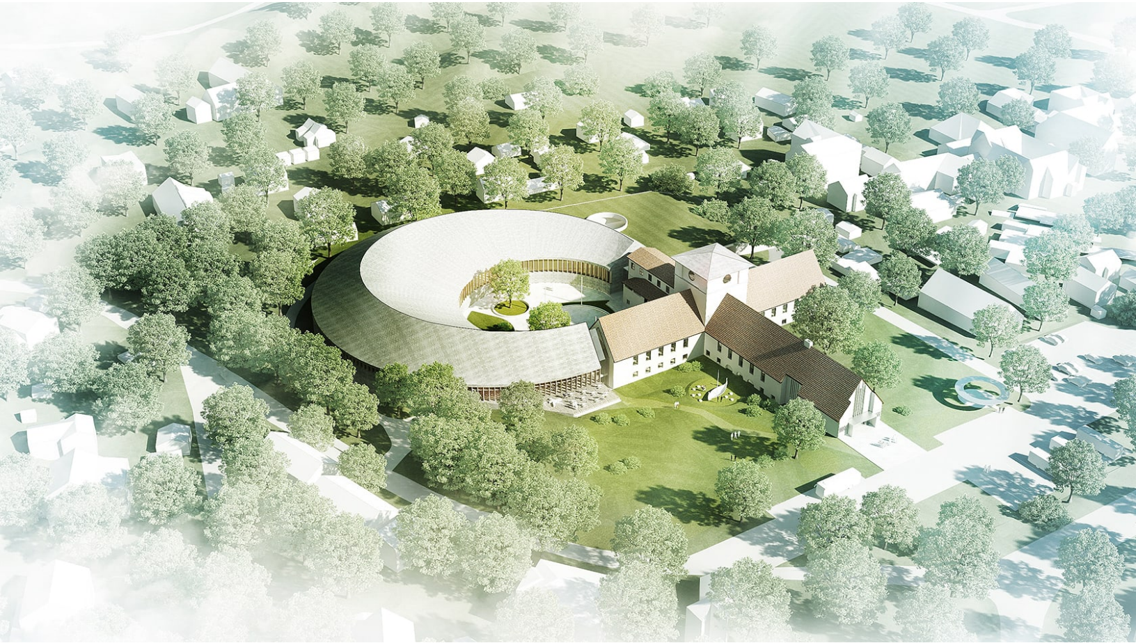
Illustrasjon av det planlagte nye Vikingetidsmuseet